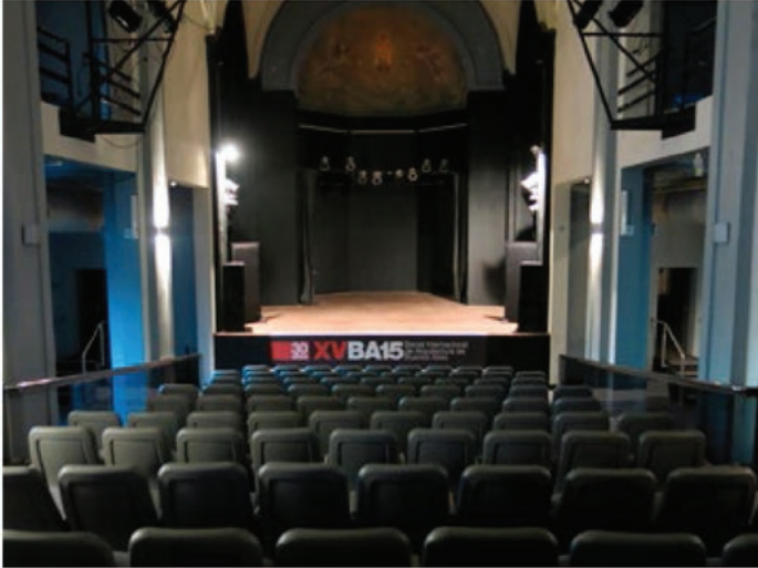
VISTA HACIA EL ESCENARIO

Espacios: descripción y especificaciones técnicas CAPILLA