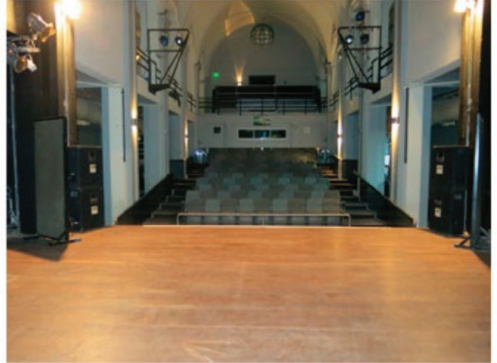
VISTA DESDE EL ESCENARIO